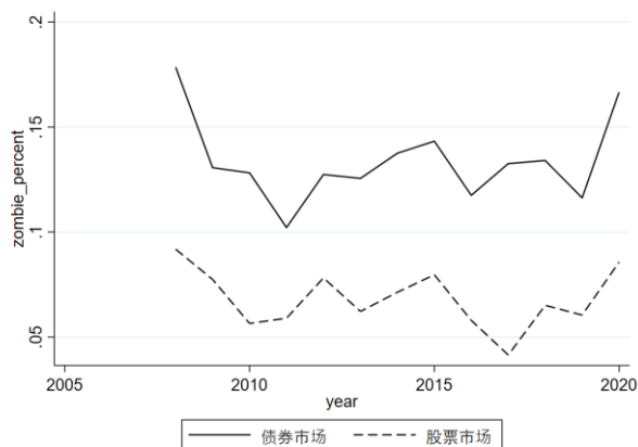
图 1 债券市场与股票市场僵尸企业比例

为此，本文首先基于 Caballero et al. (2008) 和 Fukuda and Nakamura (2011) 的经典方法（FN-CHK 法）定义了债券市场的僵尸企业。如图 1 所示，债券市场和股票市场的僵尸企业比例随时间变化保持一致，但债券市场存在大约 13% 的发债主体是僵尸企业，这个比例远高于股票市场僵尸企业比例（7%）。这一方面源于股票市场的企业可能质量更高，而债券市场进入门槛相对较低 2 ；更重要的是债券市场中僵尸企业的国有企业比例达到了 98%（见表 3）。相关研究认为地方政府行为是影响债券市场定价效率最为重要的因素（洪艳蓉，2010；吴晓求，2018） 3 。图二刻画了僵尸企业和非僵尸企业的年度票面利率均值趋势，可以看到两者趋势也在时间趋势上保持一致，但僵尸企业的收益率在绝大多数年份反而低于非僵尸企业。本文进一步采用（票面利率-债券发行后到期收益率首次估值）的差（ Overprice ）来度量票面利率的真实性 4 ，结果发现僵尸企业存在 Overprice 为负的情况 5 ，即僵尸企业的票面利率并没有得到二级市场投资者的认可，说明僵尸企业债券可能存在一级市场定价扭曲问题。这些事实验证了我国债券市场存在大量僵尸企业且定价存在一定的扭曲。